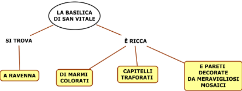
A PIANTA OTTAGONALE