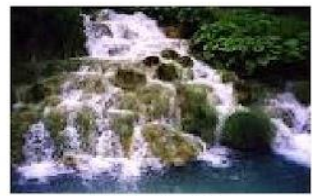
CHIARE FRESCHE DOLCI ACQUE